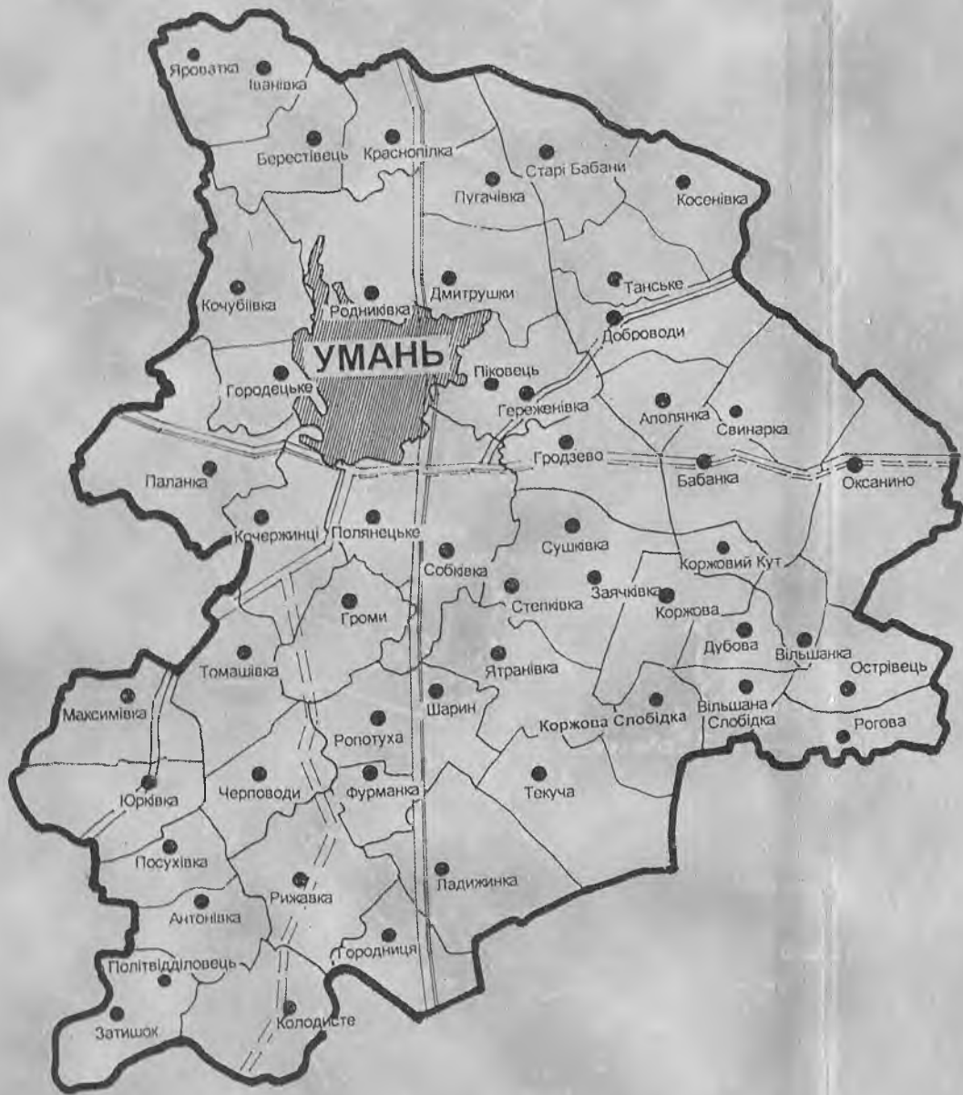
Схема Уманського району