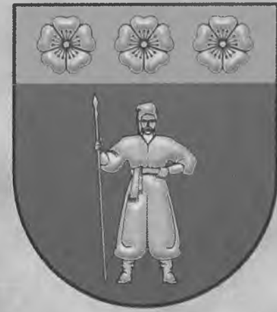
Герб Уманського району