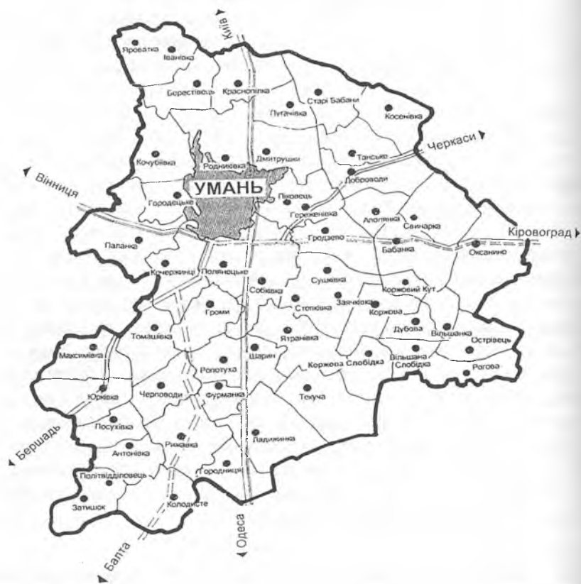
Схема Уманського району