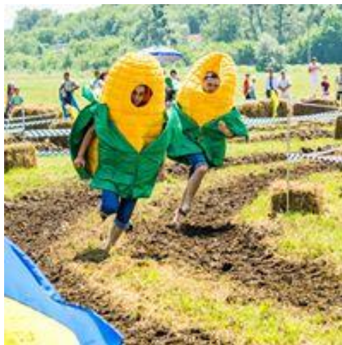
Рис. 2. Забіг «кукурудзяних початків»

Акцент фестивалю налаштований на носінні народного вбрання, дегустації смачної їжі, а також демонстрації різних ремесл. Фестивальна