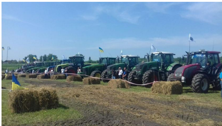
Рис. 1 Трактори готові до старту

Фесту» було облаштовано зони для майстер-класів із танців, боротьби, аквагриму, лабіринт із тюків сіна, еко-інсталяції; фотозону та гойдалку (рис. 1), яка була обладнана на тракторах. Для дітей було влаштовано цікаві атракціони.