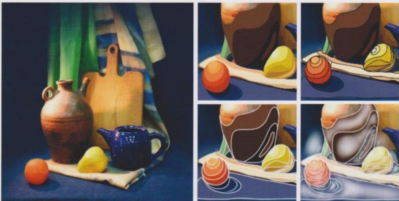
Фото 15. Цифрові способи стилізації натюрморту (авторські ілюстрації) Пічкура М. О.

Ілюстрації до статті Пічкура М. О. «Натюрморт цифрового формату: художня постановка, композиція, імітація та стилізація», с.42-49