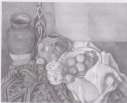
Фото 2. Сезанн Поль. «Натюрморт з яблуками і цукорницею» (1894 р.). Полотно, олія.