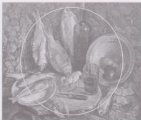
Фото 8. Кугай Анатолій. «Натюрморт з таранями та раками» (1997 р.). Полотно, олія.