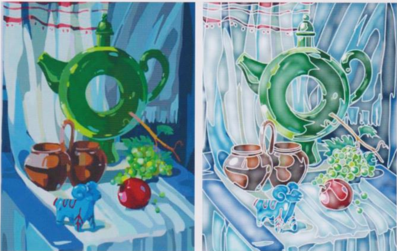
Фото 16. Чижевська Тетяна. «До кумів у гості» (2016 р.). Аплікативна і батикова стилізації у програмі «Corel Draw» (студентська робота)