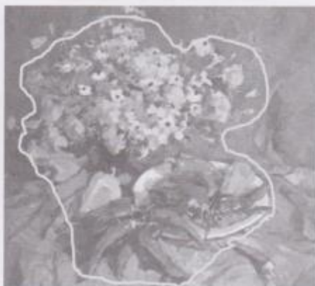
Фото 10. Кобзаренко-Кореньок Раїса. «Осінній натюрморт» (2018 р.). Полотно, олія.

Переважно відкрита композиція натюрморту передбачає широкий картинний простір, у якому більшість предметів зображена фрагментарно. У такому разі чіткість розташування композиційного центру втрачається. Часто