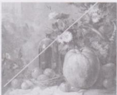
Фото 9. Грицина Віктор. «Натюрморт з гарбузом» (2010 р.). Полотно, олія.

просторове розташування предметів (фото 9).