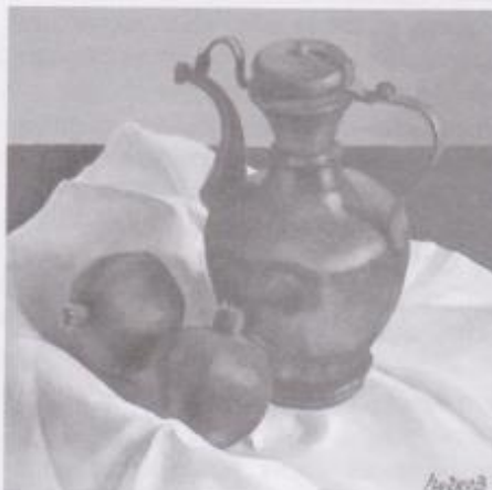
Фото 1. Пучков Юрій. «Натюрморт з гранатами» (2004 р.). Картон, темпера.

Теми для натюрмортів можуть бути найрізноманітніші. Їх шукають у різних сферах життєдіяльності людини – побуті, праці, відпочинку. Згідно з цим, зміст натюрмортів найчастіше охоплює умовну «оповідь» предметів про харчування, трудову діяльність, розваги, святкові церемонії тощо. У натюрморті також можна відтворювати певні асоціації настрою за допомогою букетів