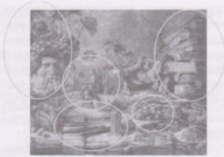
Фото 12. Рябцев Володимир. «Натюрморт 20» (2010 р.). Полотно, олія.