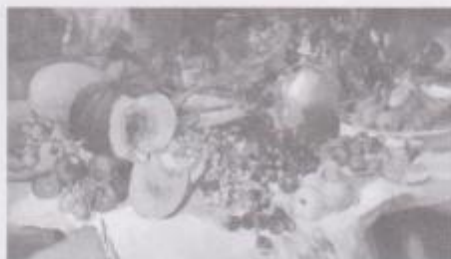
Фото 5. Жмак Віктор. «Плоди» (2012 р.). Полотно, олія.

Горизонтальна натюрмортна композиція зазвичай наближена до формату площини, де розташовано чималу кількість обраних предметів. Вона спонукає до спокійного споглядання, милування розмаїттям форм. Але її розгортання по