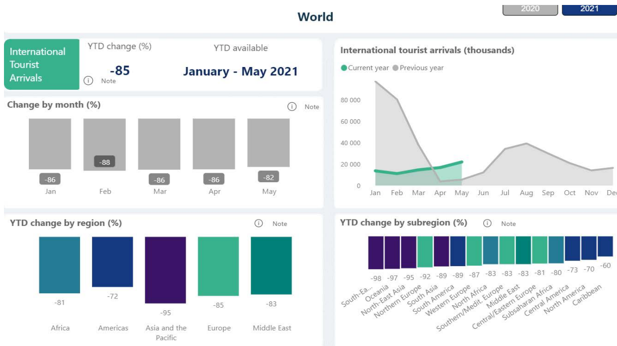
Рис. 2. Вплив пандемії COVID-19 на міжнародний туризм у 2021 році*