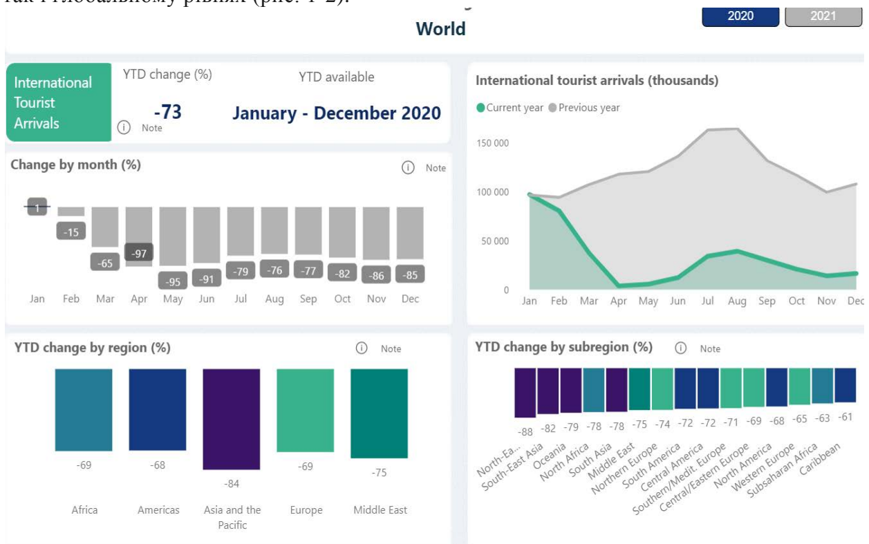
Рис. 1. Вплив пандемії COVID-19 на міжнародний туризм у 2020 році* Fig.1. The impact of the COVID-19 pandemic on international tourism in 2020 *Джерело: [1].

Оцінка впливу пандемії COVID-19 на міжнародний туризм у 2020 та 2021 роках свідчить про значне зниження кількості міжнародних туристів як на регіональному, так і глобальному рівнях (рис. 1-2).