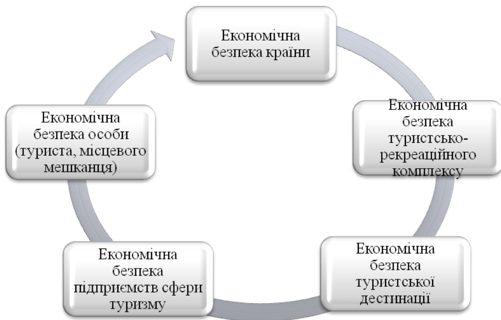
Рис. 3. Складові економічної безпеки в туризмі відповідно до об'єктів безпеки туристичної сфери*

Складові економічної безпеки в туризмі, які виокремлюються відповідно до об'єктів безпеки туристичної сфери, представлені на рис. 3.