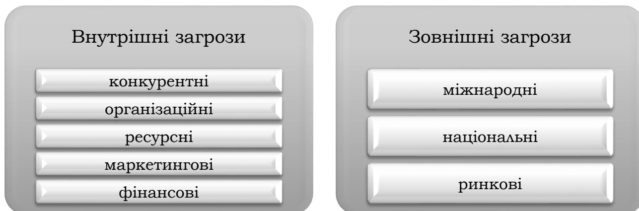
Рис. 1. Класифікація загроз економічній безпеці туристичного підприємства за джерелами (сферою) походження

Розвиток туризму в Україні останніми роками зазнає критичного впливу деструктивних чинників геополітичного та економічного простору. Це визначає необхідність формування особливої системи управління загрозами, яка повинна функціонувати як на національному рівні, так і на рівні окремих суб'єктів туристичної діяльності (Єрмаченко, 2015, с. 80).