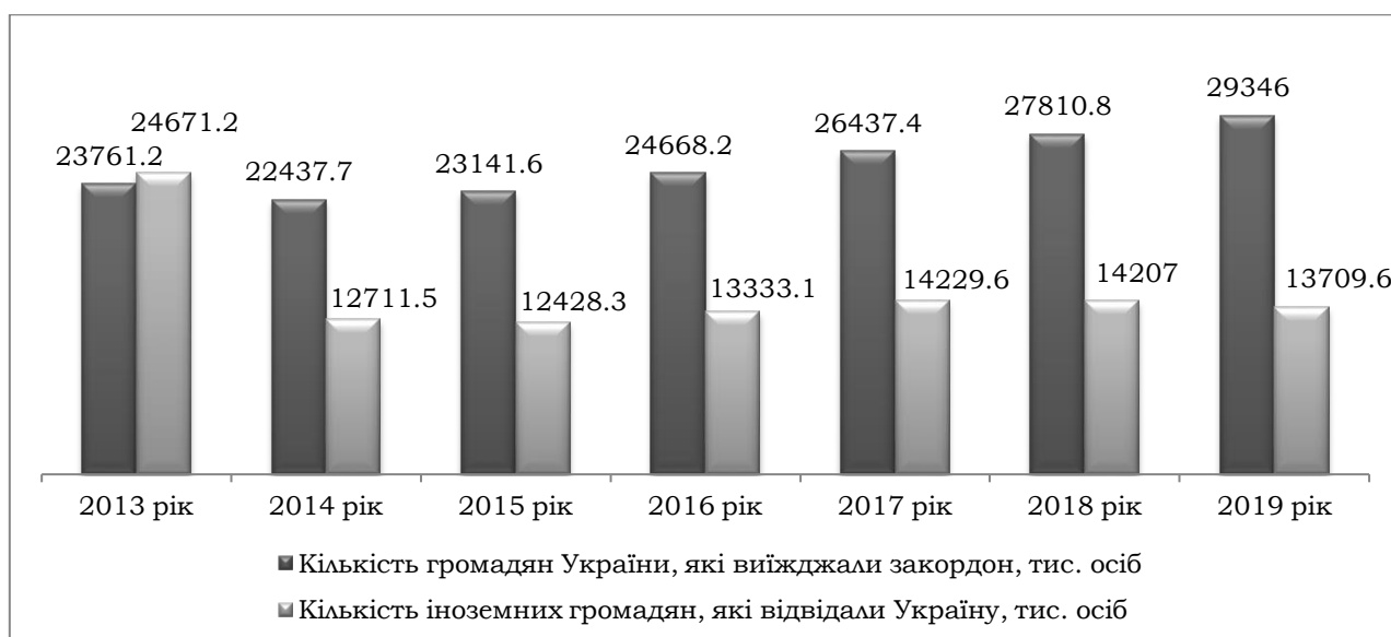
Рис. 4. Динаміка туристичних потоків в Україні в 2013–2019 рр., тис. осіб Fig. 4. Dynamics of tourist flows in Ukraine in 2013–2019, thousand people Джерело: побудовано авторами за даними Державної служби статистики 1

Досліджуючи динаміку кількості туристів, обслугованих туроператорами та турагентами, доцільно зазначити, що в 2013–2019 рр. їх загальна кількість збільшилася на 94,2%: збільшення показника відбулося в основному за рахунок тих туристів, що виїжджали за кордон (на 122,6%) (табл. 1). Кількість іноземних туристів, які відвідали Україну, за вказаний період зменшилась на 36,7%, внутрішніх – на 3,2%, що свідчить про незначне зниження попиту на внутрішній туризм.