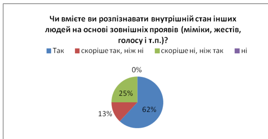
Рис. 5. Запитання 4. «Чи вмієте ви розпізнавати внутрішній стан інших людей на основі зовнішніх проявів (міміки, жестів, голосу і т.п.)?»

Опитувані дали відповіді на запитання «Чи здатні ви викликати емоції в інших людей (знижувати чи підвищувати інтенсивність емоційних проявів)?» таким чином: «так» – 23 %, «скоріше так, ніж ні» – 27 %, «скоріше ні, ніж так» – 50 %, «ні» – 0 % (рис. 6).