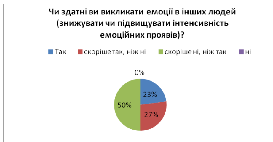
Рис. 6. Запитання 5. «Чи здатні ви викликати емоції в інших людей (знижувати чи підвищувати інтенсивність емоційних проявів)?»

Опитувані дали відповіді на запитання «Чи здатні ви викликати емоції в інших людей (знижувати чи підвищувати інтенсивність емоційних проявів)?» таким чином: «так» – 23 %, «скоріше так, ніж ні» – 27 %, «скоріше ні, ніж так» – 50 %, «ні» – 0 % (рис. 6).