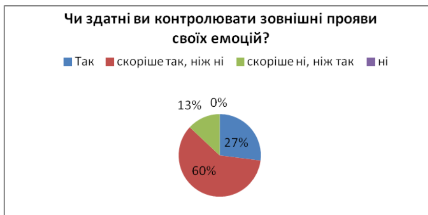
Рис. 4. Запитання 3. «Чи здатні ви контролювати зовнішні прояви своїх емоцій?»

Опитувані дали відповіді на запитання «Чи здатні ви контролювати зовнішні прояви своїх емоцій» наступним чином: «так» – 27 %, «скоріше так, ніж ні» – 60 %, «скоріше ні, ніж так» – 13 %, «ні» – 0 % (рис. 4).