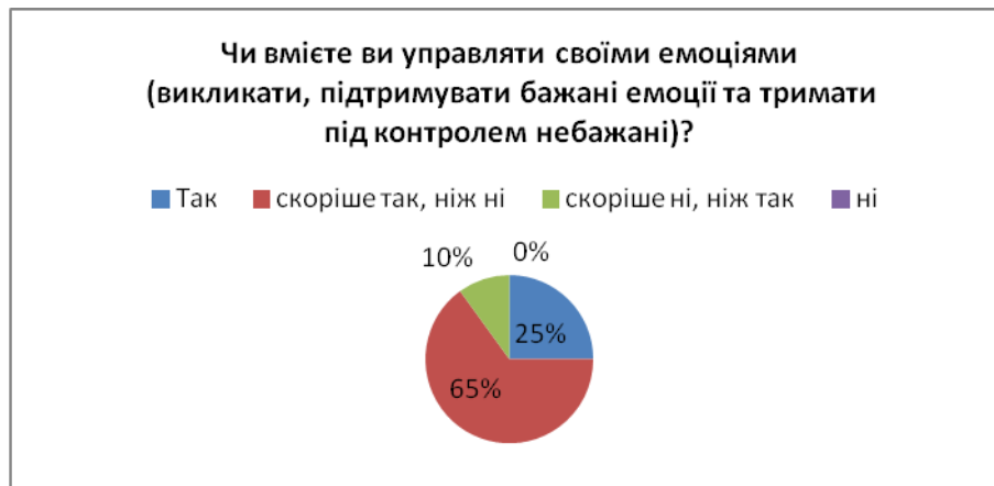
Рис. 3. Запитання 2.

На запитання «Чи вмієте ви управляти своїми емоціями (викликати, підтримувати бажані емоції та тримати під контролем небажані)?» здобувачі відповіли: «так» – 25 %, «скоріше так, ніж ні» – 65 %, «скоріше ні, ніж так» – 10 %, «ні» – 0 % (рис. 2).