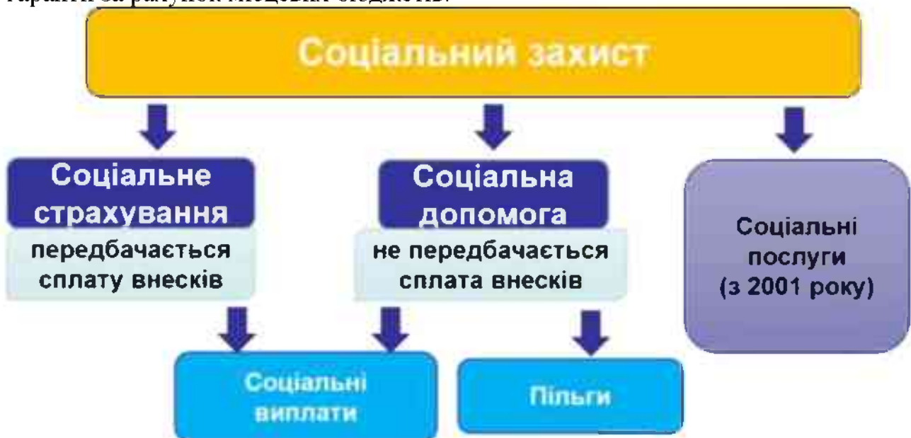
Рис. 4.3. Місце системи надання соціальних послуг загальної системи соціального захисту населення

Органи місцевого самоврядування при розробці та реалізації місцевих соціально-економічних програм можуть передбачати додаткові соціальні гарантії за рахунок місцевих бюджетів.