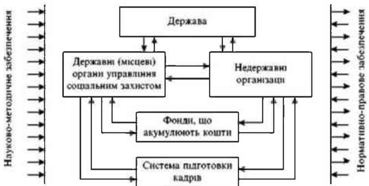
Рис. 4.1. Організаційно-правова структура системи соціального захисту населення.

Організаційно-правова структура системи соціального захисту населення виглядає так (див. рис. 4.1):