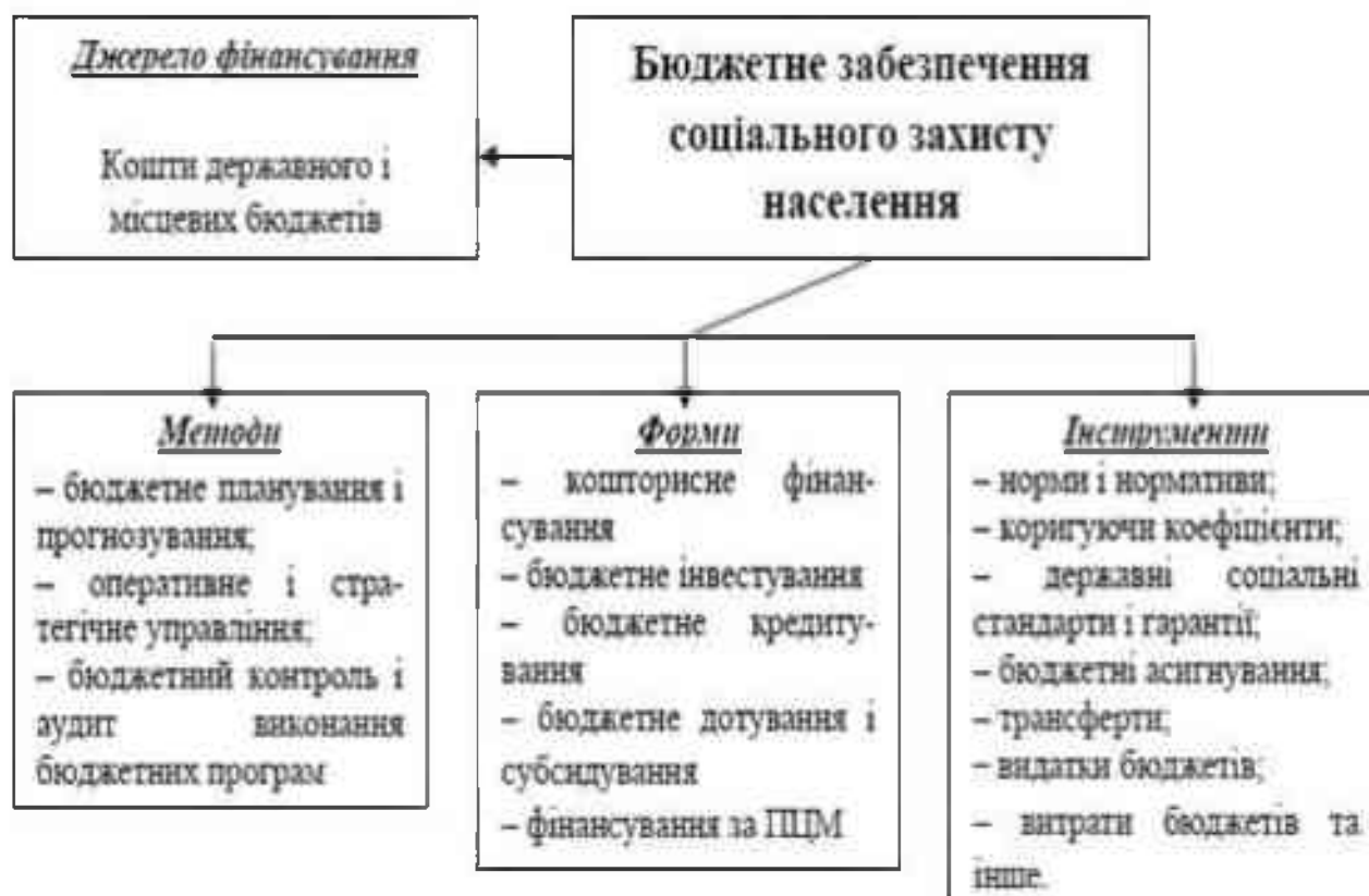
Рис. 3.1. Структура бюджетного забезпечення соціального захисту населення

За матеріальним змістом бюджетне забезпечення – це процес формування і використання коштів централізованого фонду держави шляхом визначення форм, методів, а також інструментів, які використовуються з метою задоволення суспільних потреб (див. рис. 3.1).