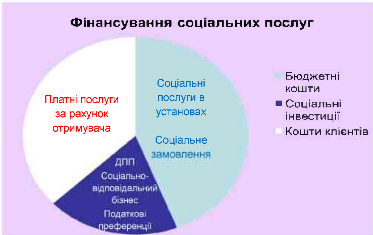
Рис. 4.4. Фінансування соціальних послуг