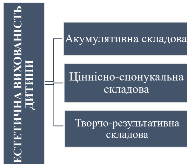
Рис.1 Складові естетичної вихованості дитини [4]

Розглянемо детальніше. Акумулятивна складова – це емоційно-позитивна реакція дитини на об’єкти та явища навколишнього середовища, асоціативно-образне оброблення естетичної інформації та знань. Протягом усієї життєдіяльності дитина сприймає, акумулює та засвоює різну інформацію. Ціннісно-спонукальна складова виражається переживаннями, потребами, інтересами, власною волевою цілеспрямованістю, а також естетичними почуттями до мистецтва, естетичним оцінюванням об’єктів і явищ навколишнього світу, естетичними мотивами до практичної роботи. До творчо-результативної складової належать прояв власної ініціативи дитиною, її самореалізація в творчій діяльності, естетична інтерпретація вражень [4, с.77-78].