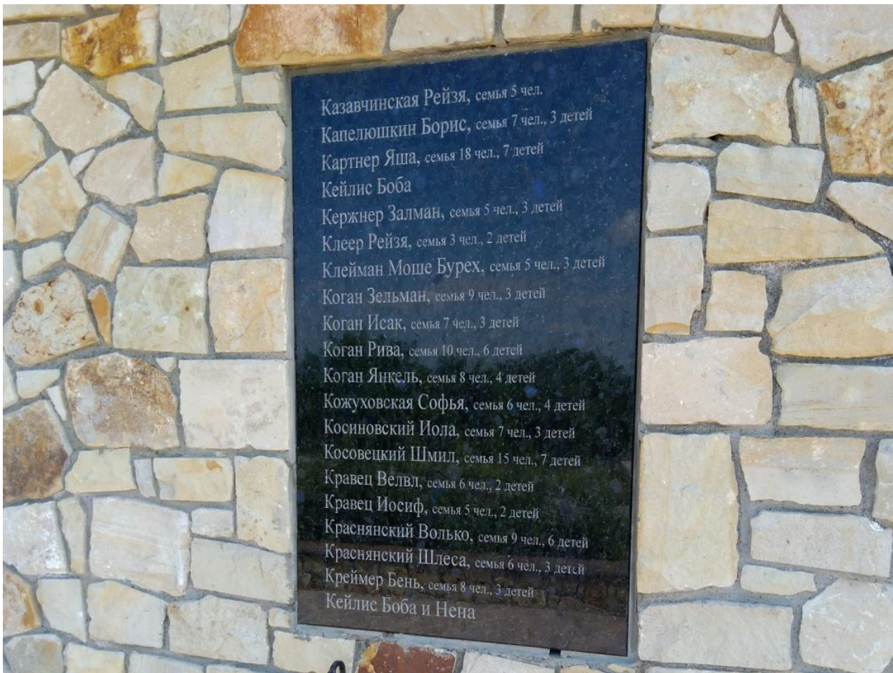
Рис. 3 Фрагмент Стіни плачу із зазначеними прізвищами загиблих

Але й досі не всі прізвища загиблих встановлені і робота з уточнення списків розстріляних триває, і, у разі віднайдення нових прізвищ, Стіна плачу буде ними доповнюватися [3,4].