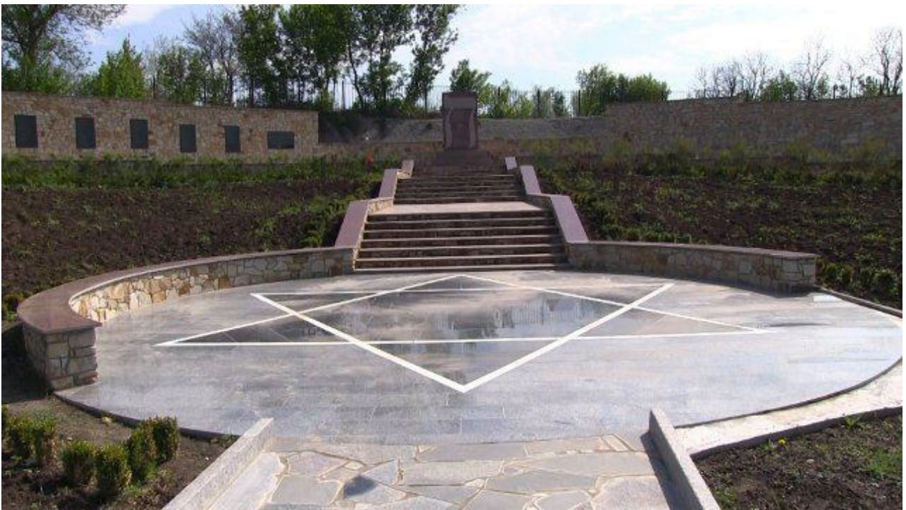
Рис. 2 Меморіальний комплекс «Хашуватська трагедія», відкритий у 2014 р.