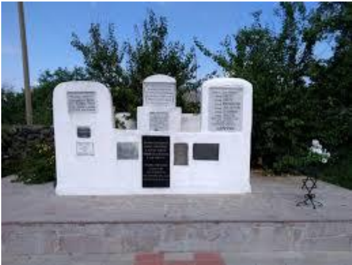
Рис. 1 Меморіал жертвам Голокосту (зберігся до наших днів)

Після війни на місці розстрілу було споруджено скромний меморіал, до якого щороку 16 лютого та 9 травня приїздили люди з близького та далекого зарубіжжя – Росії, Узбекистану, США, Ізраїлю, Німеччини (рис. 1).