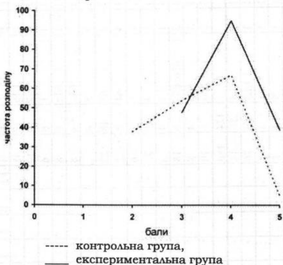
Рис. 1. Розподіл балів за рівнем сформованості мотиваційно-ціннісного компонента правової компетентності студентів

Узагальнені результати методів і методик діагностики когнітивно-комунікативного компонента правової компетентності студентів, отримані після проведення першого етапу реалізації програми формуального експерименту показані на рис. 1.