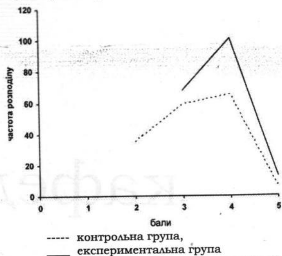
Рис. 3 Розподіл балів за рівнем сформованості мотиваційно-ціннісного компонента правової компетентності студентів

вової компетентності студентів аграрного університету.