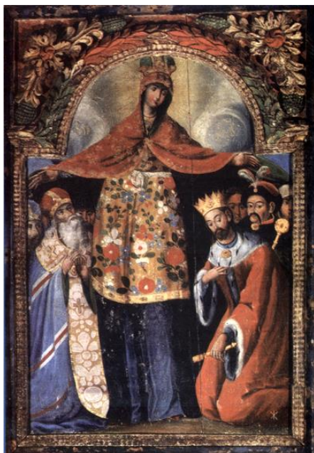
Мал. 2. Покров Богородиці з портретом Б. Хмельницького (кін. XVII ст.).

Психологічний аспект сприйняття кольору пов'язаний із соціокультурним та естетичним аспектами. Будь-який окремо взятий колір чи поєднання кольорів може сприйматися людиною по-різному, залежно від культурно-історичного контексту, від просторового розташування колірної плями, його форми й фактури, від налаштованості й культурного рівня глядачів і багатьох інших чинників.