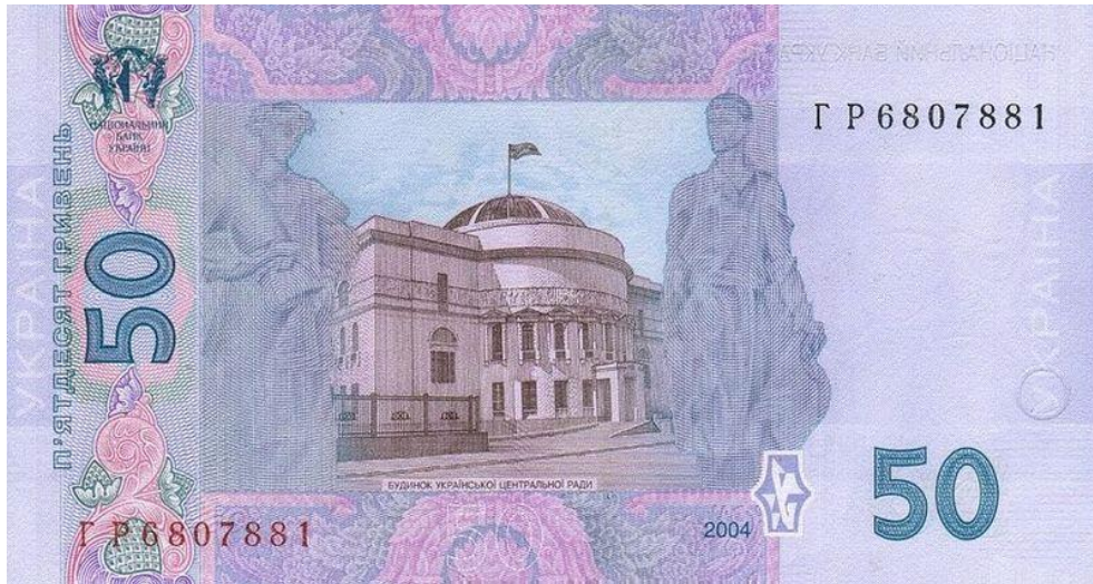
Рис. 5. Реверс п'ятдесяти гривень зразка 2004 року.

рік друку, а також номінал, зазначений числом і прописом. Дизайн обох боків доповнено орнаментом (рис. 5).