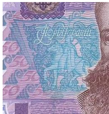
Рис. 2. Фрагмент центральної частини 50-ти гривень зразка 2004 року із трансформованим зображенням роботи В. Кричевського.

Етнічним мотивом є центральна частина аверсного боку банкноти (рис. 2). На ній авторами грошового знаку трансформовано фрагмент обкладинки книги М. Грушевського «Історія України» (автор роботи В. Кричевський (рис. 3).