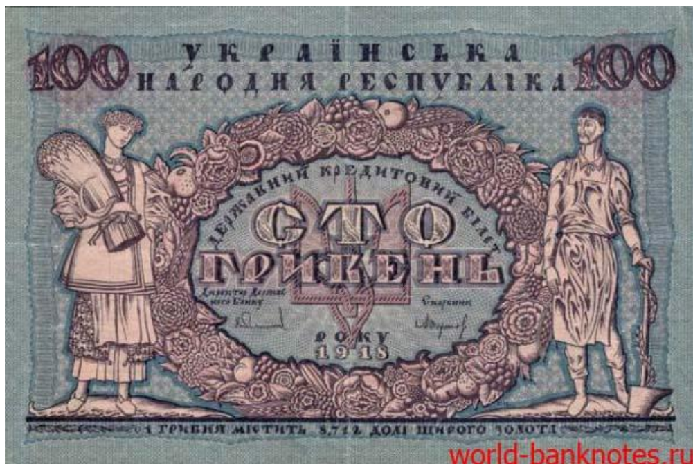
Рис. 4. Аверс 100 гривень зразка 1918 року. Автор ескізу Г. Нарбут.

Автором ескізу банкноти номінальною вартістю 100 гривень 1918 року в Українській Народній Республіці був художник Георгій Нарбут. На аверсній стороні грошового знаку в центрі розміщено тризуб. Оформлення доповнювало зображення селянки зі снопом і робітника з молотом на тлі вінка з квітів і плодів. На лицьовій стороні також розміщені написи «Українська Народна Республіка» і «Державний кредитний квиток», зазначено рік випуску, номінал числом і прописом, а також підписи директора банку й скарбника (рис. 4).