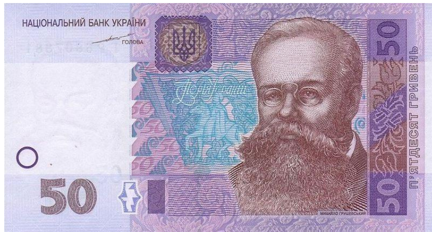
Рис. 1. Аверс п'ятдесяти гривень зразка 2004 року.