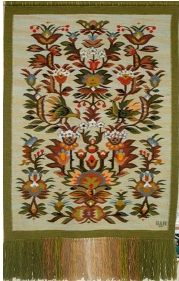
Веселка. 2007 р.

Загалом варто зазначити, що сучасний український тематичний гобелен зберігає усталену техніку звичайного гладенького килима, а за своїм змістом і характером художнього виконання органічно пов'язаний із традиціями народної творчості. Він виступає не тільки декоративною окрасою, художнім акцентом у загальному оформленні інтер'єру, а й самостійним витвором, який образно відтворює світ.