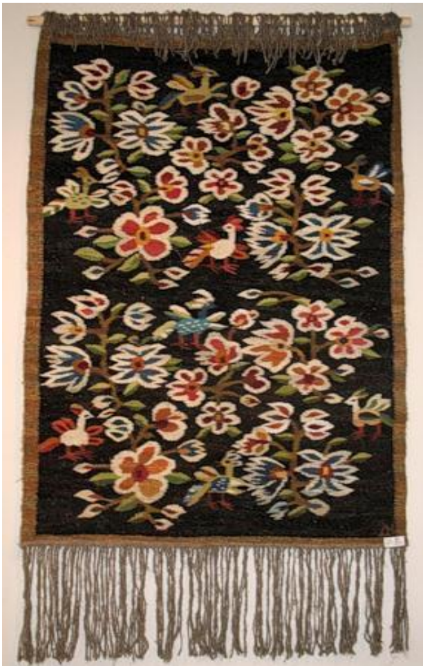
Квітуча земля. 2010 р.