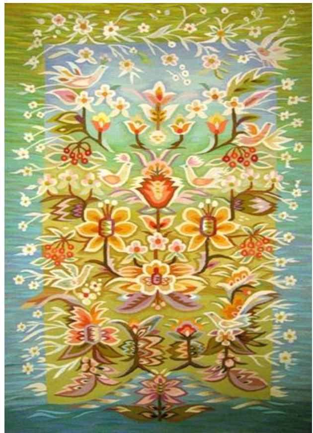
Світанок. 2008 р.