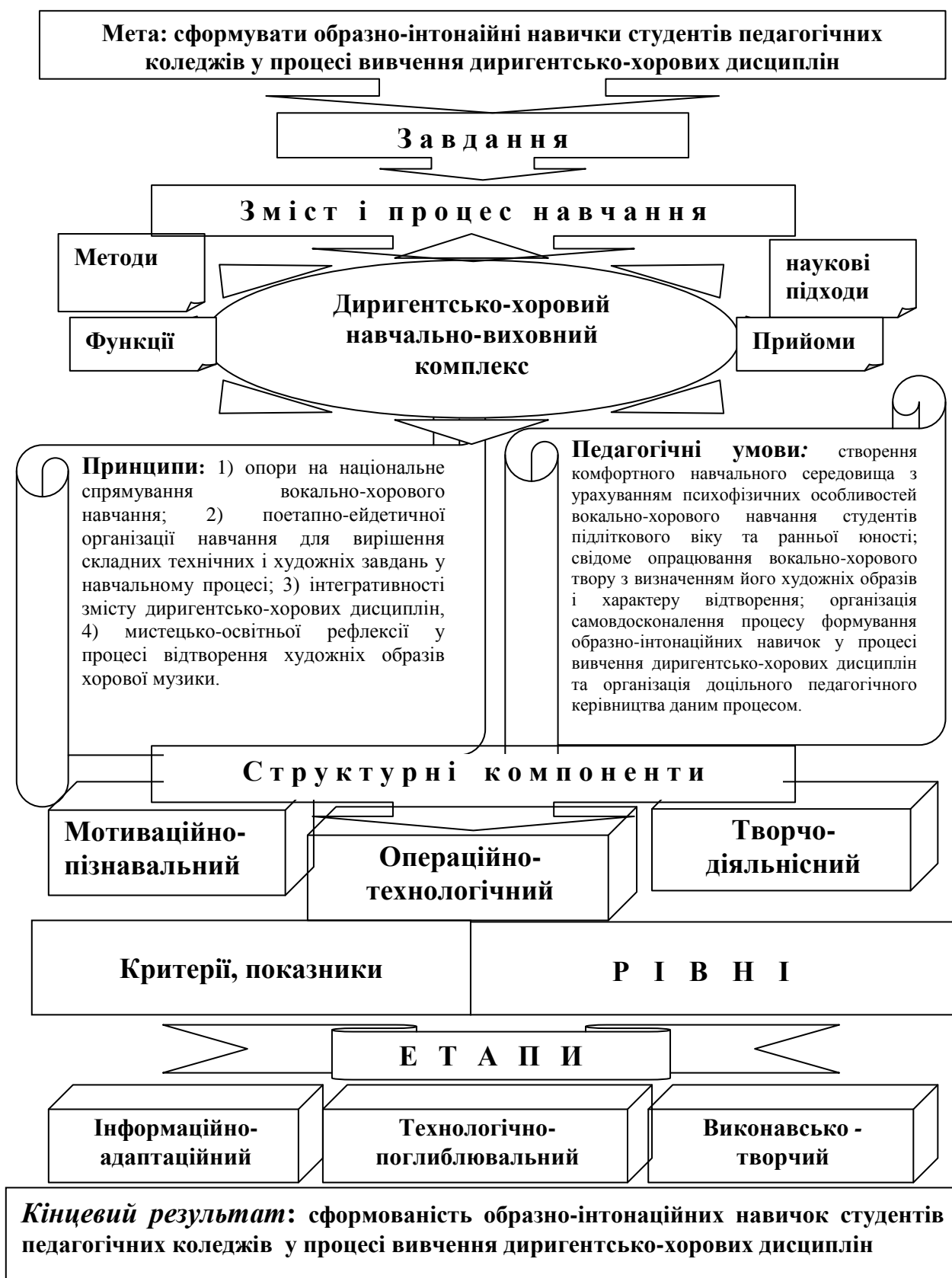
Рис. І. Організаційно-методична модель формування образно-інтонаційних навичок студентів педагогічних коледжів у процесі вивчення диригентсько-хорових дисциплін.

У третьому розділі – «Дослідно-експериментальна робота з формування образно-інтонаційних навичок студентів коледжів у процесі вивчення