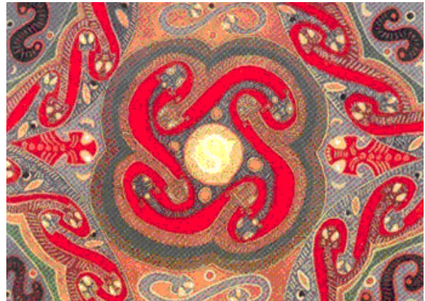
Мал. 1. Колористика трипільських орнаментів [7].

Колористика Трипілья позначилася на перевагах теплої кольорової гами в мистецтві й побуті Київської Русі. Зокрема, червоний колір символізував красу, тобто все, що пов'язувалося з поняттями «красивий» і «святковий», називалося червоним: красна дівиця, красне слово, красне сонце. Наприклад, святковий одяг червоного кольору добре контрастував з яскраво зеленою природою України.