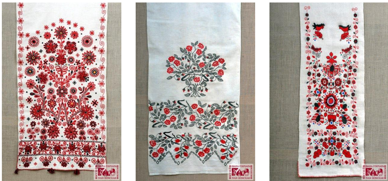
Мал. 2. Зразки рушників Полтавщини, Чернігівщини, Черкащини.

Згодом, у зв'язку зі зміцненням культурних зв'язків між країнами Заходу й Сходу, у мистецтві України, поряд із традиціями Київської Русі, виникають нові колористичні вподобання. Надалі під впливом культури Російської Імперії, зокрема, у XIX столітті бурхливо розвивалась художня промисловість, котра, як зазначає С. Прищенко, черпала з художніх ремесел і народної творчості традиційні й найбільш досконалі форми, наприклад, мотиви геометричних, рослинних і зооморфних орнаментів і характерну колористичну гаму, що складалася із червоного й зеленого кольорів у сполученні з невеликою кількістю чорного [5, с. 41]. Особливого звучання поєднання чорного й червоного кольорів набуло у вишиванках різних регіонів України (мал. 2).