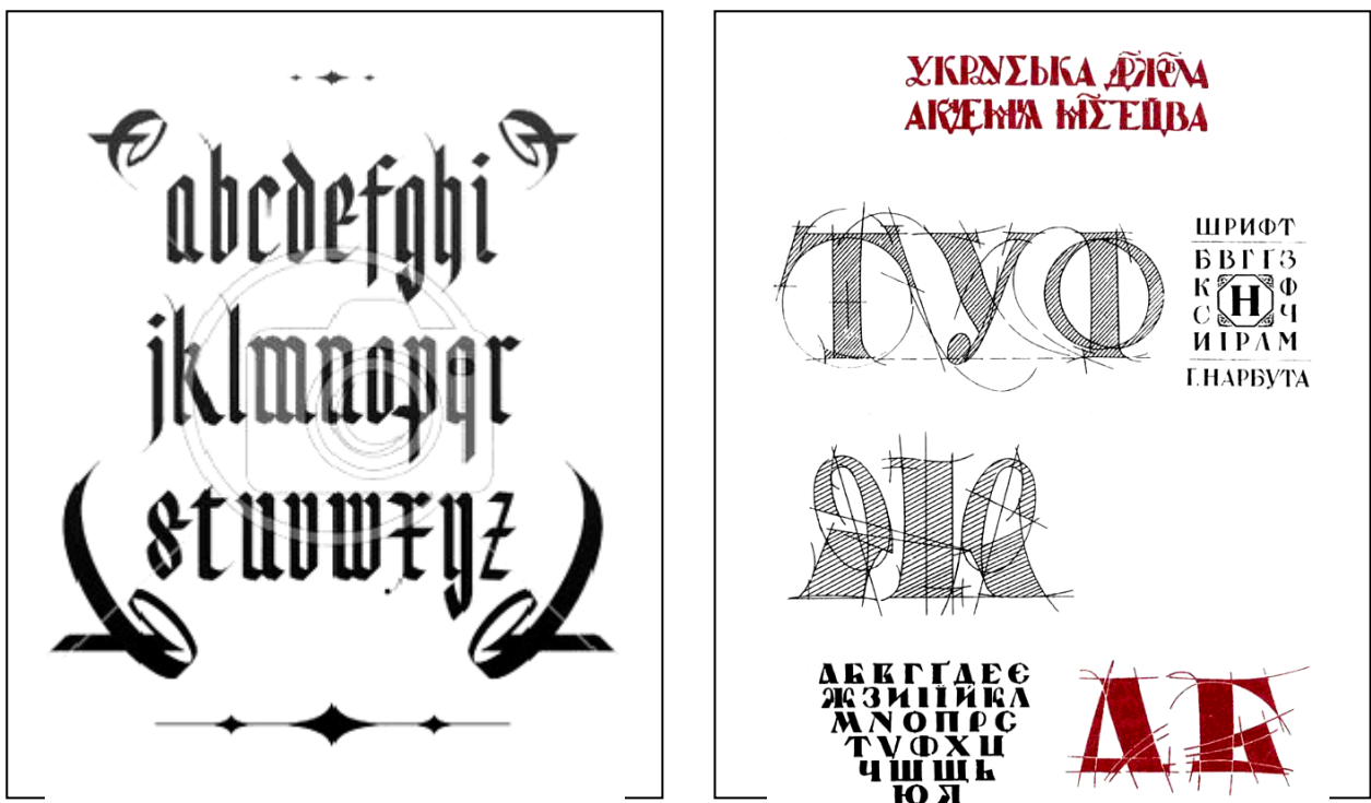
Рис. 3. Готична гарнітура та шрифт Г. Нарбута

Та не лише орнаментика має етнічну своєрідність. Як знаково-символічна форма комунікації, шрифти також відрізняються своїми національними особливостями, що зумовлені природними антропологічними відмінностями. Це пояснюється тим, що чим далі народи перебувають один від одного, тим сильніше відрізняються їхня культура й мова. Хіба можна сплутати готичну гарнітуру, що характерна для німецької нації й характеризується гостротою графем і ламаними обрисами, зі шрифтом Г. Нарбута (рис. 3).