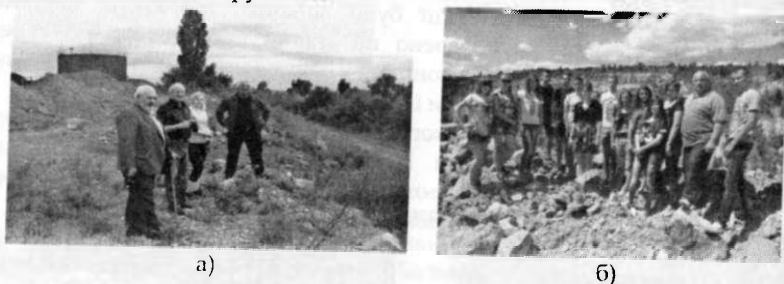
Рис. 6. (а, б). Вивчення кар'єру:

Унікальність родовища, розміщення кар'єру, можливість огляду і вивчення відслонень гірських порід приваблюють науковців, студентів з близького і далекого зарубіжжя.