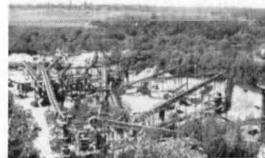
Рис. 2. Гайворонський спеціалізований кар'єр.

За три роки становлення кар'єру (1938-1940 рр.) було вироблено: побутового каменю – 27200 м 3 , шашки – 2800 м 3 , щебеню – 4800 м 3 . Нині такий обсяг продукції підприємство виробляє усього за 10 днів без застосування ручної праці (рис.2).