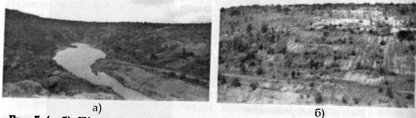
Рис. 5. (а, б). Південно-Східна зона Заваллівського графітового кар'єру:

Площа Заваллівського графітового родовища становить близько 50 км 2 . Добування графітової руди здійснюється відкритим способом. Кар'єр має глибину 170 м, довжину до 2 км, поблизу нього знаходиться відвал пустих порід висотою 75 м (рис. 5) [4].