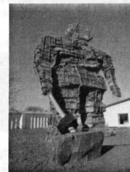
Рис.3. Пам'ятник першим каменоломам.

Потужні розрізи кар'єру своїм виглядом і унікальністю приваблюють фахівців з України та інших країн.