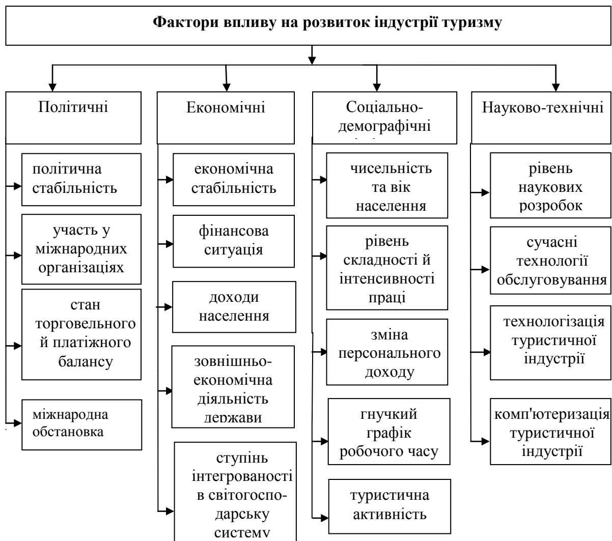
Рис. 2. Фактори впливу на розвиток індустрії туризму

Необхідною умовою функціонування туристичної індустрії є стабільна політична обстановка в країні. На розвиток туризму впливають фактори, пов'язані з політичною, законодавчо-правовою та соціально-економічною ситуацією в країні і в світі (рис. 2).